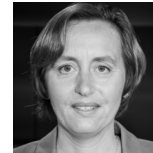
BEATRIX VON STORCH

STELLV. BUNDESVORSITZENDE, STELLV. FRAKTIONS-VORSITZENDE IM BUNDESTAG